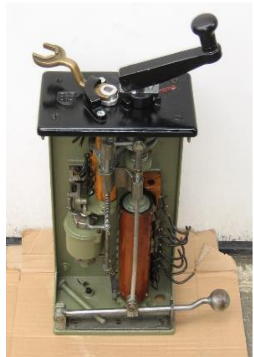
Linker foto: de twee rijcontrollers van de 252; de rechter is al bijna klaar, de linker moet nog gedaan worden. Rechterfoto: de rijcontroller gereed voor inbouw. Rechtsonder is het dodemanspedaal zichtbaar.