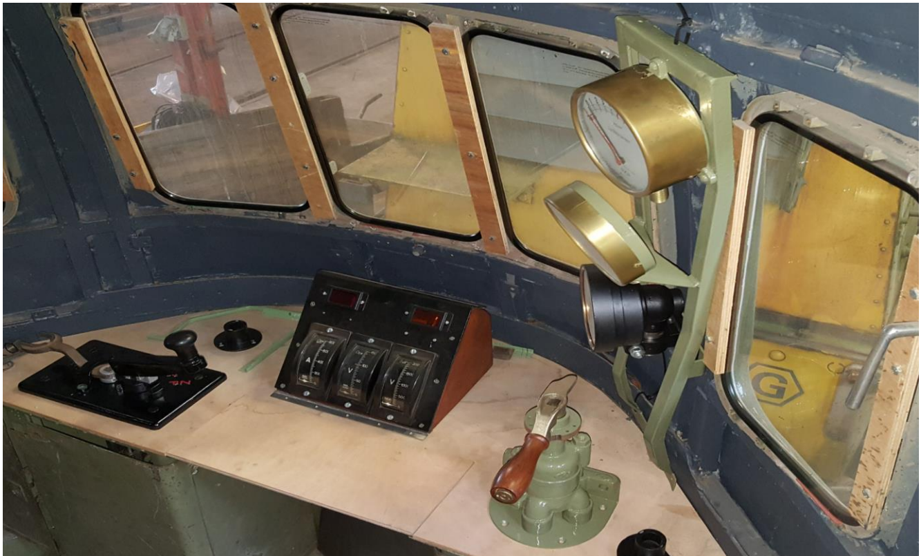
Een blik in een van de cabines met de ingebouwde cabine-apparatuur.